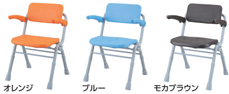
オレンジ ブルー モカブラウン